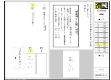
漢検 CBT 画面イメージ (「書き」問題)

当教室では、今年度より、「漢検CBT (Computer Based Testing)」を利用した漢字検定試験を実施しております。当教室にて、専用のタブレット端末を使って受検することができます。(漢検CBTで受検できる級は2級～7級です)。漢検CBTは、難易度・出題内容とも、学校で受検している漢検と変わりません。 (一部出題形式が異なる問題もあります)